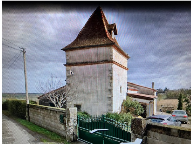
La Bartharie (Mailhoc, 81)