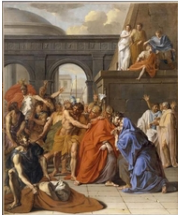
Grand May de Notre-Dame de 1661 9