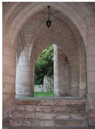
Eglise saint-Eloi de Mailhoc (81)