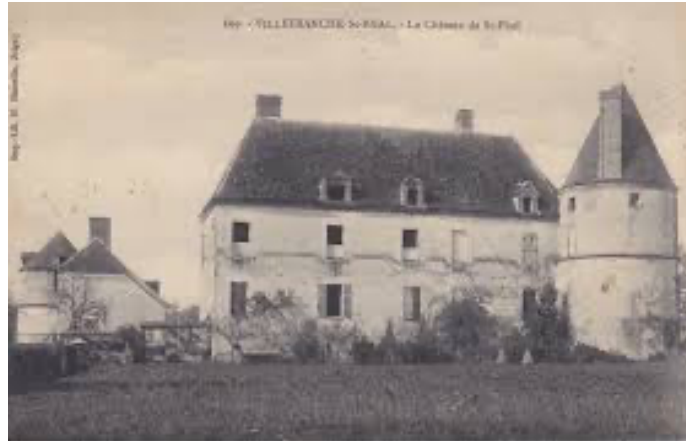
Château de Saint-Phal 12 (Villefranche-St-Phal)