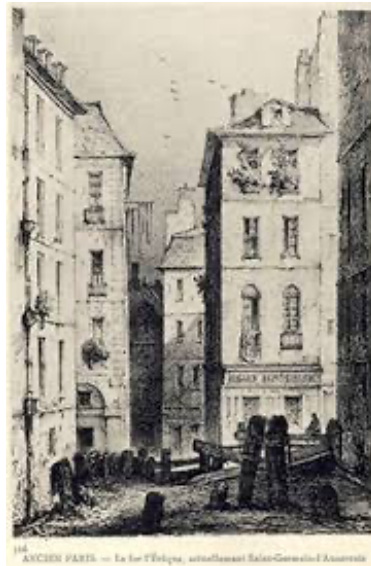
Prison de Fort-l'Evêque