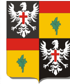
Château de Dampierre-sous-Bouhy