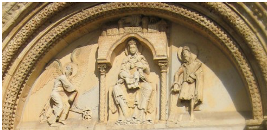
Tympans de Donzy-le-Pré – Sceau de Mahaut de Courtenay