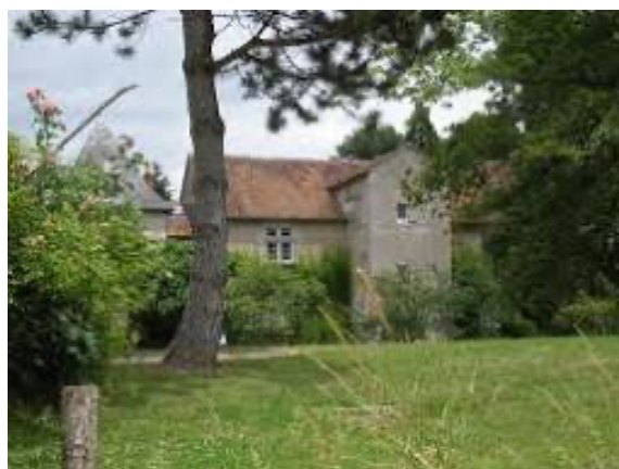
Manoir des Granges (Cours, 58)