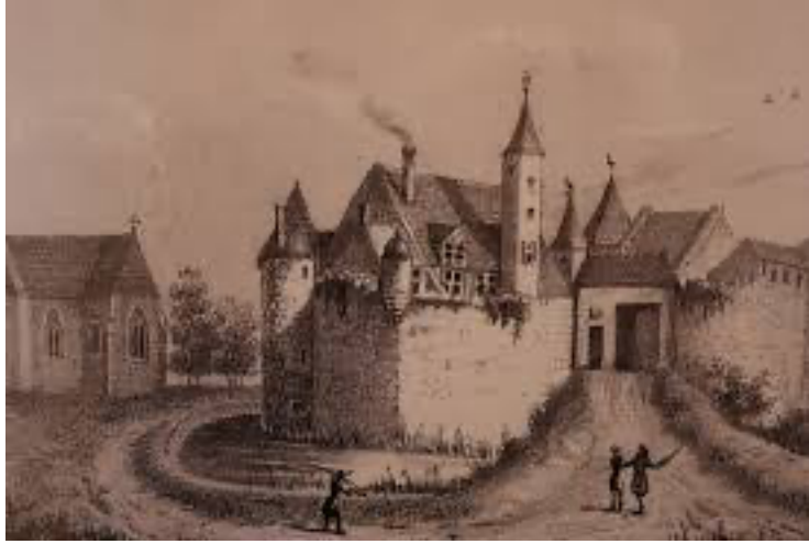
Vergers (Sully-la-Tour), vers 1830