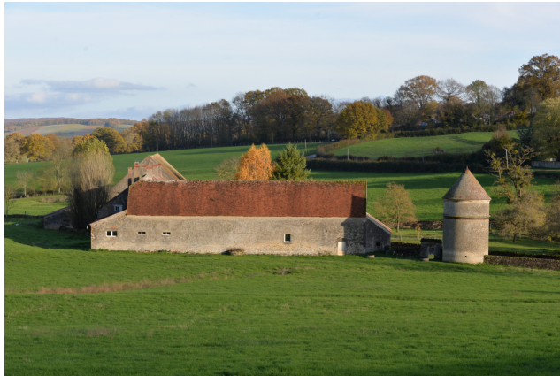
Château de Chazeuil-le-Bas

Procureur fiscal de Chazeuil – voir cette notice -