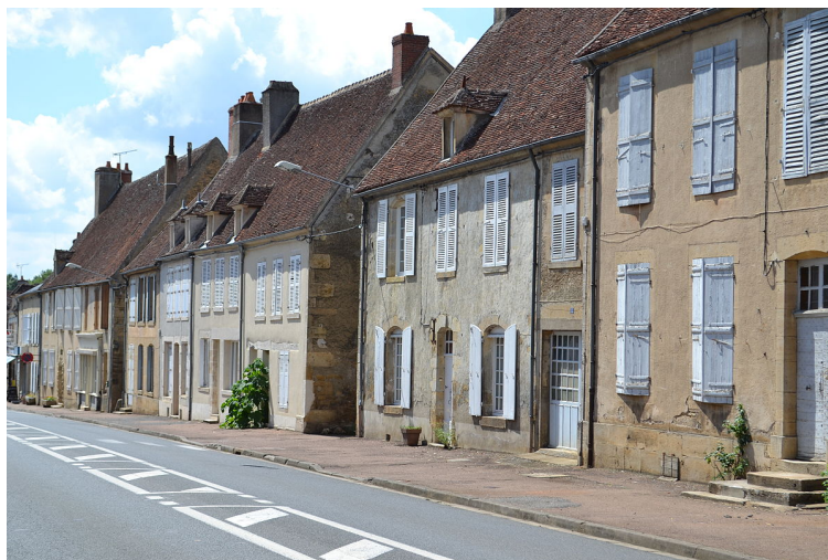
Champlemy, rue principale, maisons XVIIIème