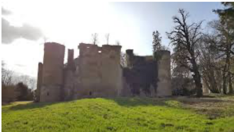
Ancien château de Champlemy

Procureur fiscal et notaire royal de Champlemy