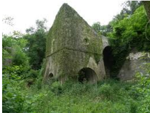
Fourneau de Cramain (Chasnay)