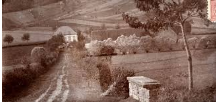
Pernay (à Nannay)