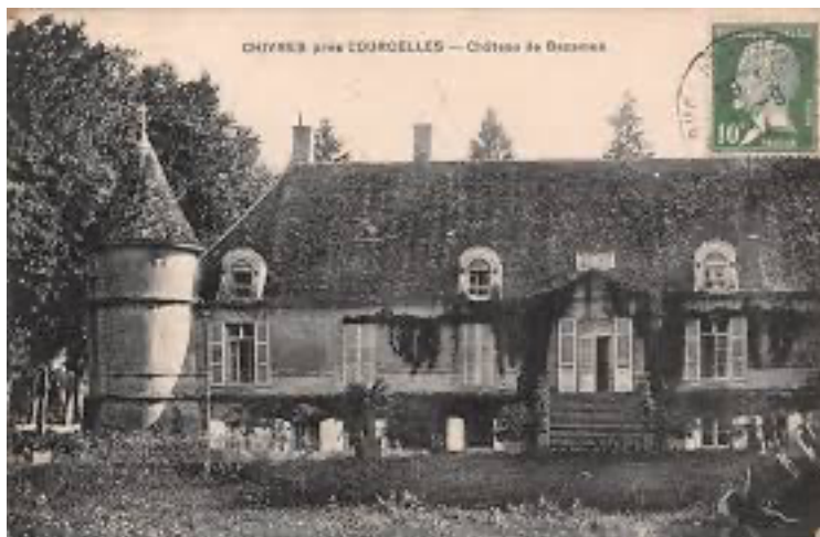
Château de Bazarnes (Courcelles, 58)