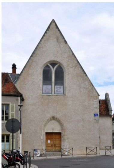
La Charité, ancienne église St-Pierre

Maître boulanger, inh. sous la chaire de l'église Saint-Pierre