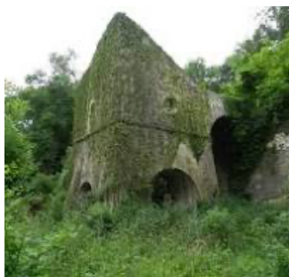
Le Four de Cramain (Chasnay)