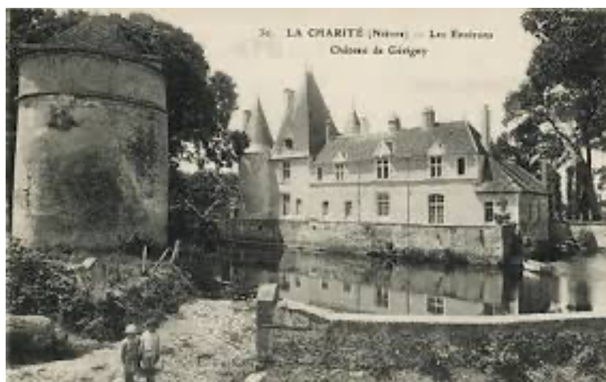
Château de Gêrigny, La Charité-sur-Loire