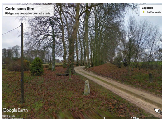
Entrée du domaine de la Pouvesle

5bis/ Pierre BUCHET (5 juin 1681, Sancerre – 1733)