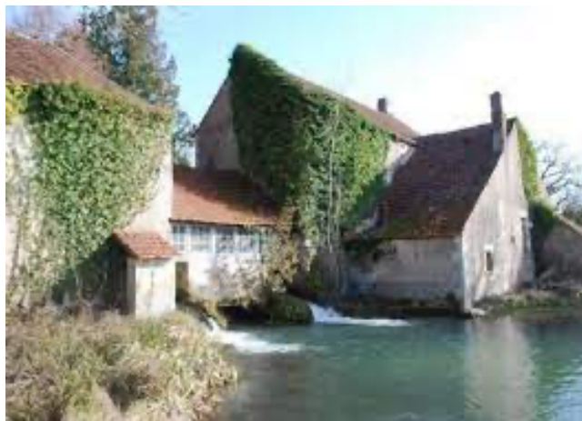
- Moulin de Saint-Quentin