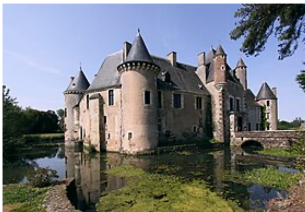
Château de Boucard (Le Noyer, 18)