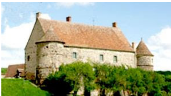
Château de Jars (18)

Avocat, Bailli de Jars et Boucard, échevin de Sancerre, proc. fisc. Du comté