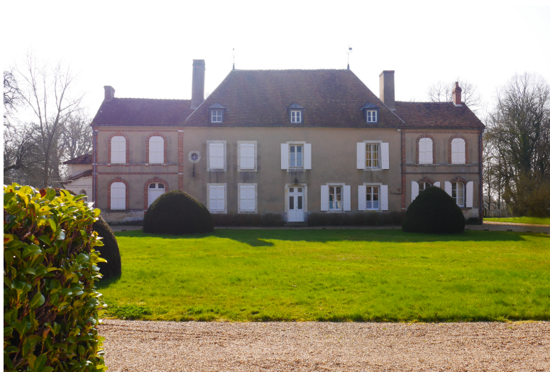
Le Jarrier, La Celle-sur-Loire