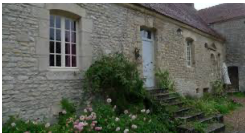
Manoir de Favray