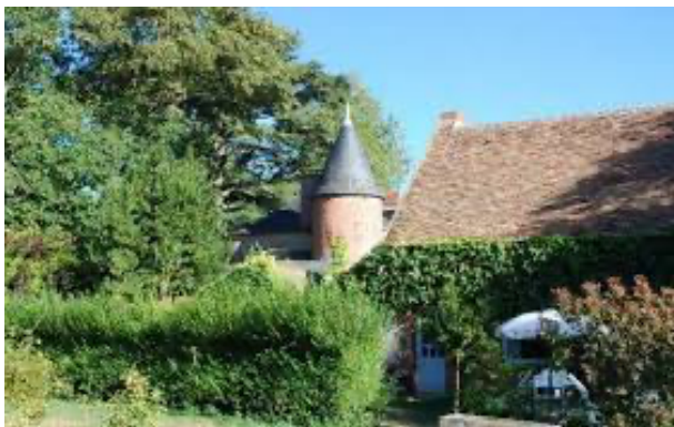
Le Liarnois (St-Père)