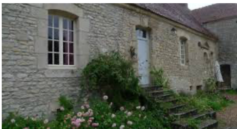
Manoir de Favray (XVIème)