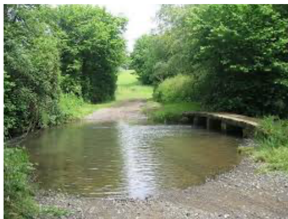
Champdoux, gué sur l'Accotin