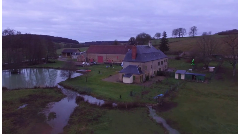
Le Bouchot (La Fermeté, 58)