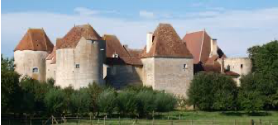
La Motte-Josserand (Perroy)

Sgr de la Motte-Josserand 1 et du Bouchot (1727-1732) 2 , fermier pour partie du Prieuré de la Charité 3 ; fermier des forges ducales de l'Eminence et de Champdoux.