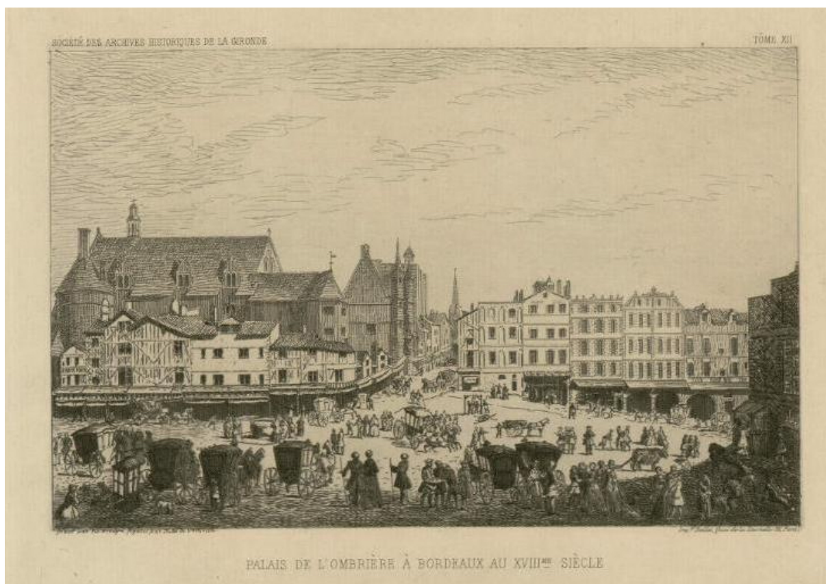
Palais de l'Ombrière à Bordeaux (XVIII ème s.), siège du Parlement

Bourgeois de Paris (originaire de Bordeaux ?), Trésorier payeur des gages des officiers de la Chancellerie du Parlement de Bordeaux.