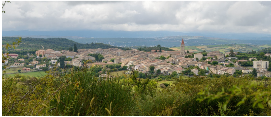
Villeneuve de Berg