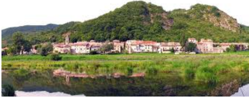
Village de Baix (Ardèche)