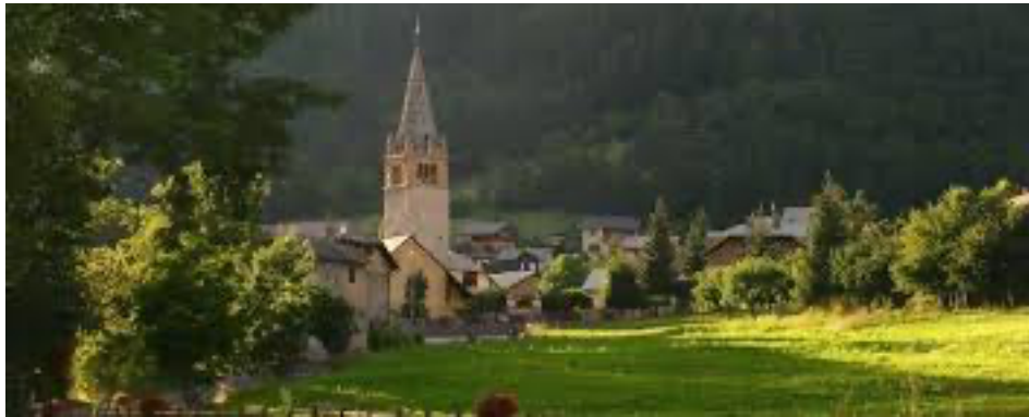
Village de St-Pons, en Ubaye