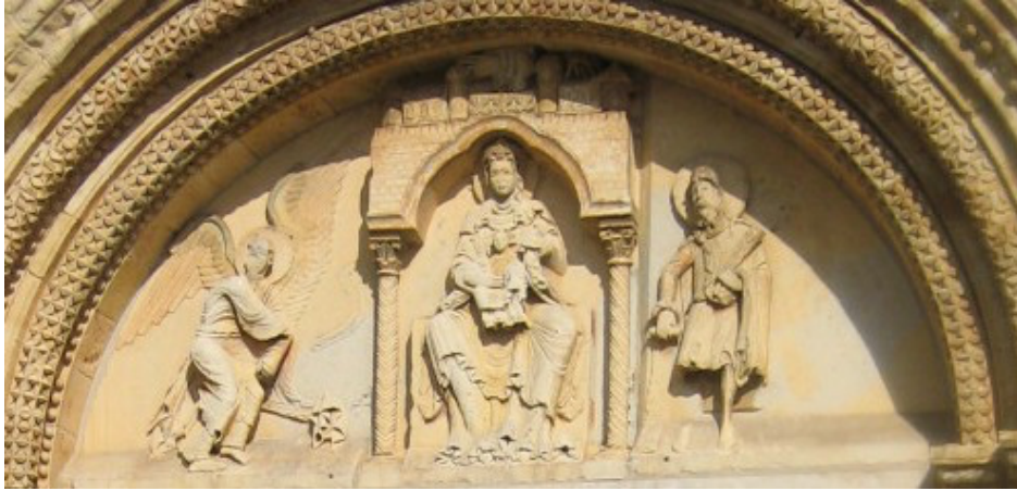
Tympans de Donzy-le-Pré – Sceau de Mahaut de Courtenay