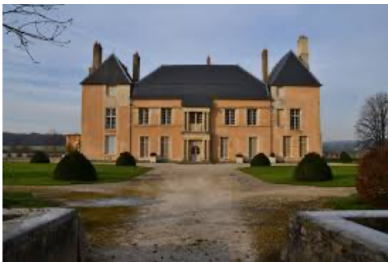
Château de Sauvage (Beaumont-la-Ferrière, 58)