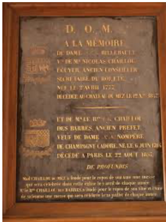
Plaque commémorative (Eglise de Sainpuits)