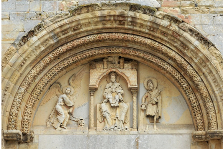
Tympan de Donzy-le-Pré – Sceau de Mahaut de Courtenay