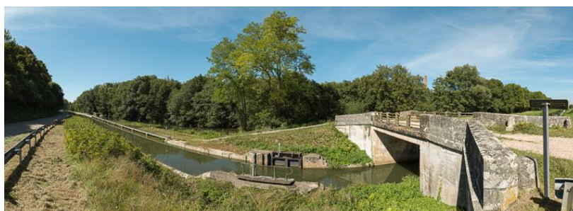
Pigeonnier de Bèze – le Canal à Lucy/Yonne

Le manoir de Bèze (parfois écrit Besze dans les actes) avec sa ferme, à Lucy-sur-Yonne, au bord de l'Yonne canalisée, face à Crain, était le siège d'un fief ancien relevant de Chatel-Censoir, qui a peut-être donné son nom à la famille du théologien calviniste Théodore de Bèze, établie à Vézelay et en Nivernais.