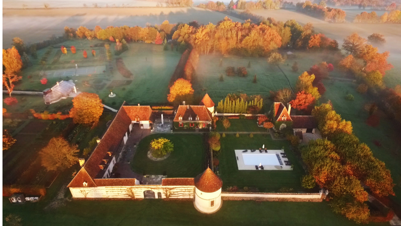
La Borde (Leugny)