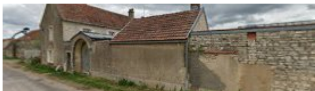
Le Clos du Merry à Joux (89)